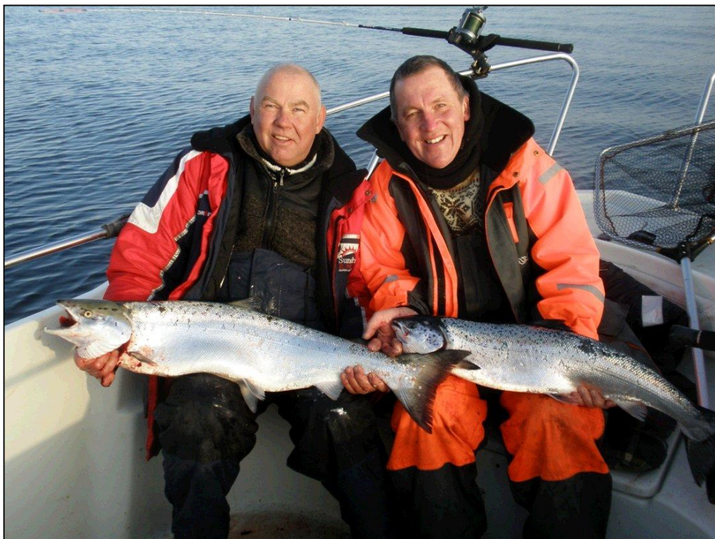
Et par meget overstadige laksefiskere